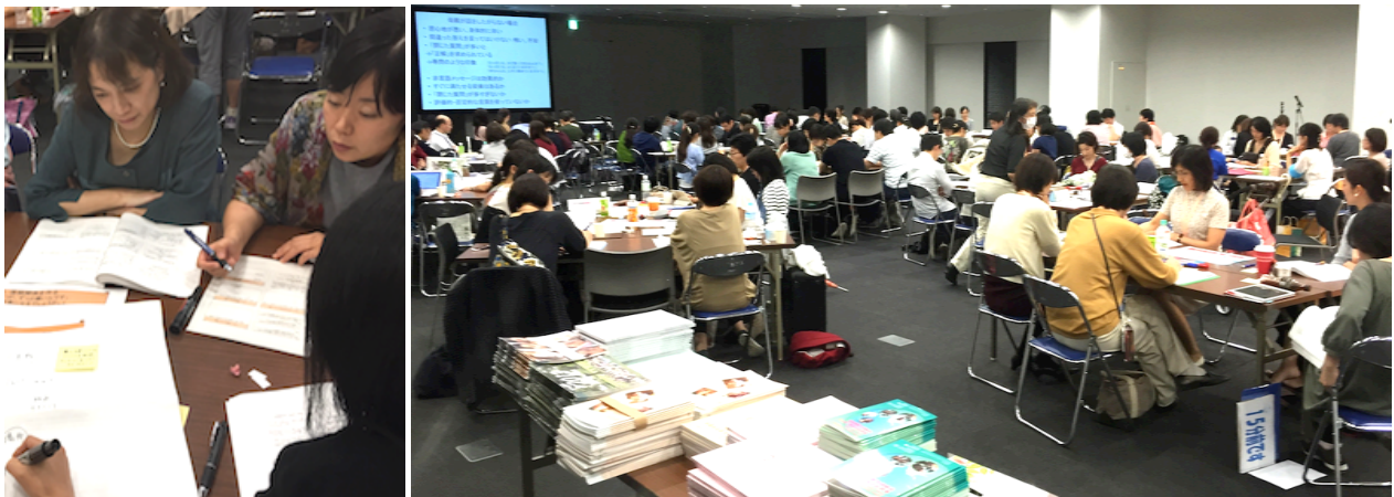
2016年の会場風景（ワークショップの様子）

日本周産期・新生児医学会周産期専門医研修会（2単位）、日本小児科学会新更新単位小児科領域講習（1単位）、日本産科婦人科学会・日本専門医機構単位発行了承済、日本産婦人科医会研修単位申請中、日本医師会生涯教育単位申請中